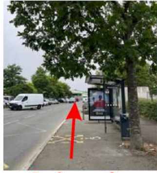
Repère : arrêt maisons rouges