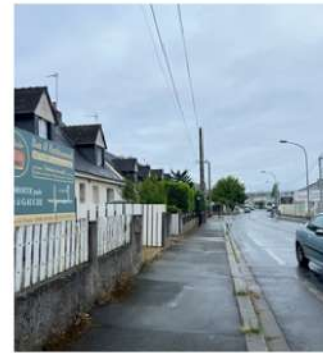
Continuez tout droit