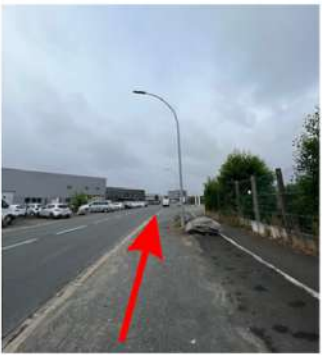
Continuez tout droit jusqu'au prochain rond point