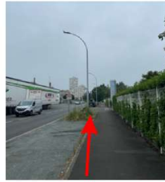
Continuez tout droit