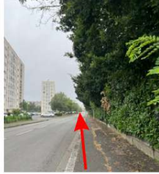
Continuez tout droit