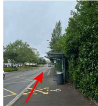
Repère : arrêt les Gâts