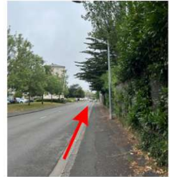
Continuez tout droit